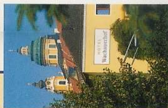
Zufahrt zum Hotelparkplatz

Impressum: Foto & Text: Läckinger, Herstellung: gugler crossmedia, melk